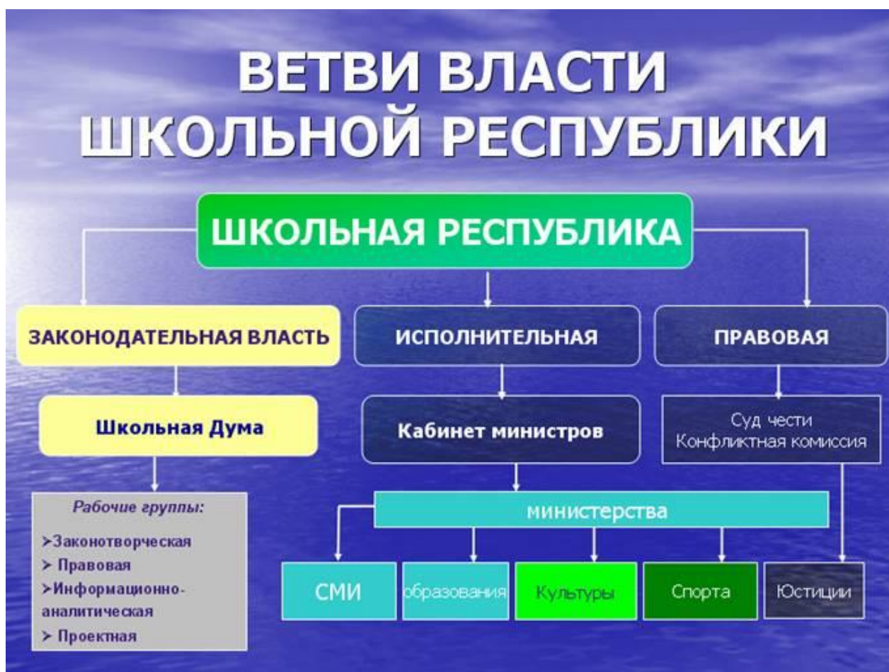
Схема власти школьной республики

Выше были изложены основные сферы деятельности всех ветвей власти, но мы хотим обратить внимание на проектную группу в работе школьной Думы.