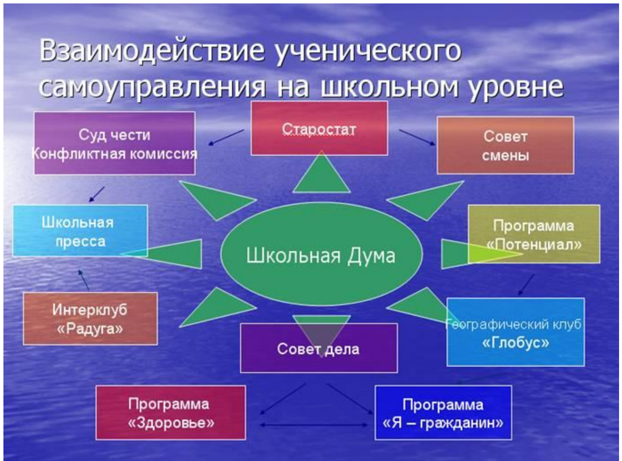
Схема взаимодействия ученического самоуправления

В данной схеме прописаны связи ученического самоуправления со школьными объединениями, которые возглавляют учащиеся школы. Это географический клуб «Глобус», интернациональный клуб «Радуга», в которых создана своя структура самоуправления с выходом на школьный уровень и общешкольные программы деятельности: «Я-гражданин», «Потенциал», «Здоровье».